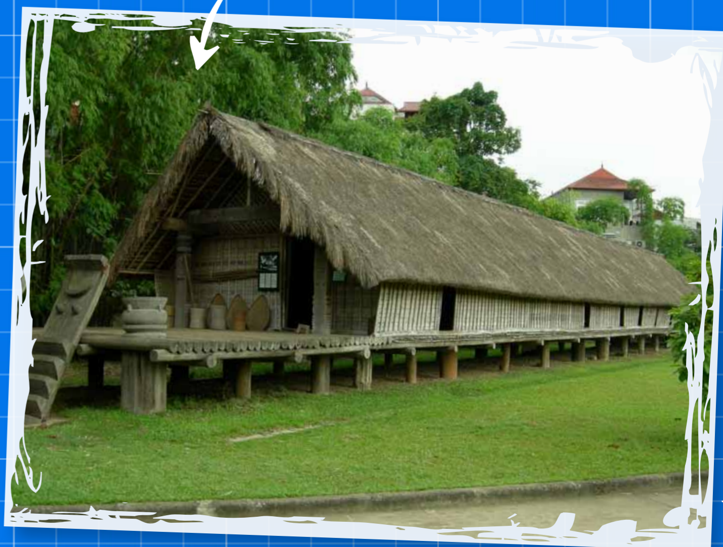
długi dom w Wietnamie